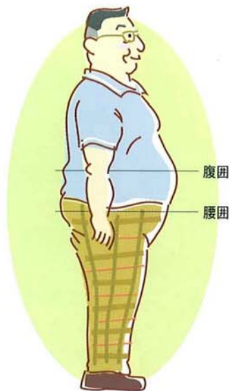
腹部型(内臓脂肪型)肥満 (別名りんご型肥満、男性型肥満)

その他、中性脂肪が高くなり動脈硬化を進めるコレステロール値が増え、そのため、高脂血症が起こりやすくなります。また女性は乳ガンや子宮ガンにかかる率が高いことも報告されています。